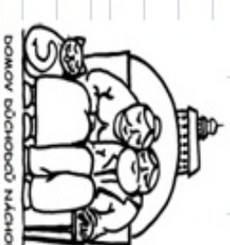
DOMOV DŮCHODCŮ NÁCHOD